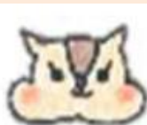
りす組 (1歳児クラス)