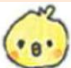
ひよこ組 (0歳児クラス)