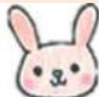
うさぎ組 (2歳児クラス)