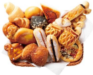
選ぶのが楽しい焼き立てパン