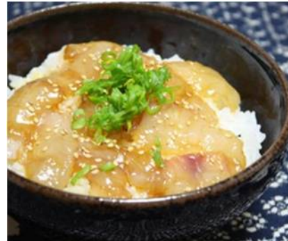
東京産食材使用 メダイの漬け丼