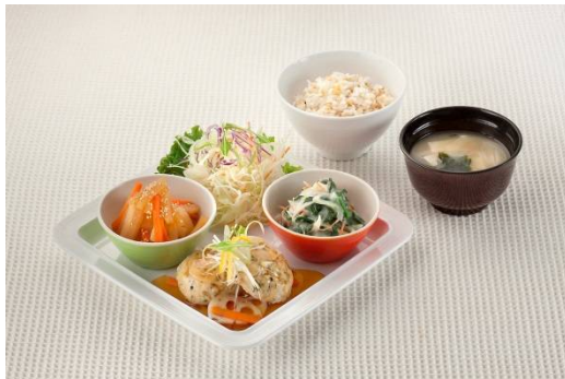
ヘルシーベジ定食